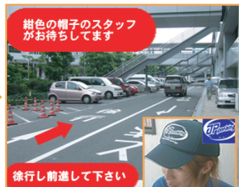
★ 紺色の帽子のスタッフがお待ちしております!