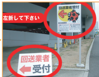
3 回送業者受付カンバンを左折