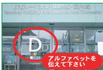
2 自動扉のアルファベット文字をお電話にてご連絡ください