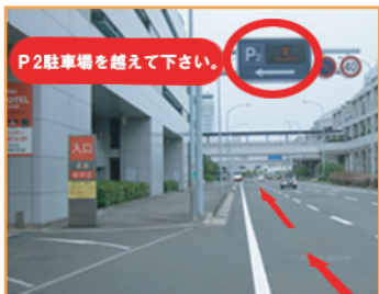
1 P2駐車場を越えて前進して下さい