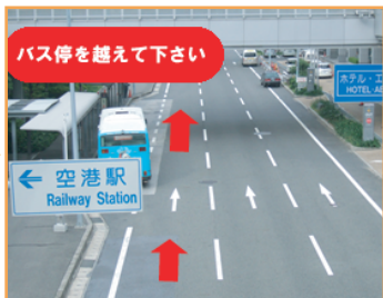
2 バス停を越え前進して下さい