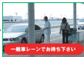
★ 一般車レーンでお待ちください お客様のお車をお持ちいたします